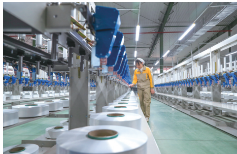
恒力（泸州）产业园纺织一期项目生产车间