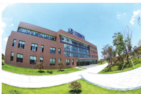
川南航天能源科技有限公司外景

制曲等白酒配套产业项目外，未来还将建设龙马酒庄、体验式酒店等文旅结合项目，该项目全面建成后有望成为中国最大的浓酱兼香白酒生产基地。 漫步在冬日的郎酒泸州浓酱兼香基地内，曲香与草木共融，酒意与流水同酿，酒香氤氲间，工人们又开启了新一天的酿造。 在龙马潭区，空气中飘散着浓郁香气的不仅仅只有郎酒泸州浓酱兼香基地。10公里外，在位于龙马潭区特兴街的食品饮料工业园内，四川巴蜀好利食品有限公司生产车间里的工人们熟练地操作着设备，和面、烘焙、晾凉、包装……每一个香甜面包的出炉，都在为全省万亿级食品饮料产业加力赋能。 在园区内，像四川巴蜀好利食品有限公司这样的企业还有13家。今年，随着园区内福润食品豆类深加工及植物蛋白项目、泸州肥儿粉生产基地项目等7个产业项目的陆续新开工，预计到2025年，园区可实现年产值100亿元以上。 “做优做强产业存量，做大做好产业增量。未来5年，龙马潭区将采取产业链招商的办法，引导产业链企业加速空间集聚，提升专业化招商水平，构建产业链集群发展和企业协同发展的产业服务体系与生态环境。力争引进100亿元以上投资项目2-3个，50亿元以上投资项目5个，20亿元以上投资项目10个。”龙马潭区委书记靳地胜说。