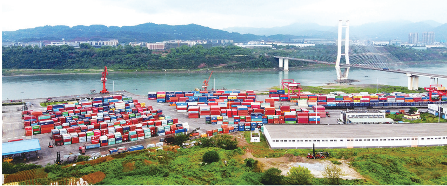
航拍的天府首港——泸州港