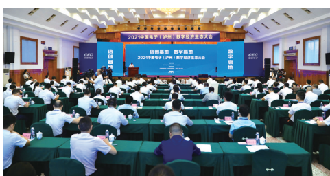
中国电子（泸州）数字经济生态大会