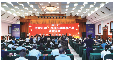
四川长城电脑下线仪式现场

工作人员将电脑主板放置在流水板上，按下传送按钮，将流水板交由机器人组装内存条、散热器等部件……11月10日，在位于泸州国家高新区中国电子（泸州）产业园内四川长城计算机系统有限公司（以下简称“四川长城”）的生产线上，人机正在高效协同地开展作业。车间内，工人屈指可数，在这里，生产线智能化程度达到70%。 日产“泸州造”电脑1000台，年产30万台，四川长城的产品已覆盖四川、重庆、云南、贵州、广西、新疆、西藏、青海等地，泸州速度在泸州国家高新区发挥得淋漓尽致。 今年，是“十四五”开局之年，如何与时代发展同频共振？产业发展如何实现“撑杆跳”？泸州国家高新区给出答案。