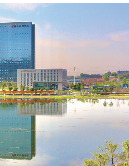
泸州新晋网红打卡地——渔子溪生态湿地公园

9月24日，投资8亿元的全球最大差速器生产基地正式落户泸州国家高新区。签约仪式上，说起选址泸州的理由，项目投资方成都豪能科技股份有限公司董事长向朝东表示，“泸州市委、市政府推动地方经济升级发展的决心、信心和行动力，以及高新区管委会建设园区、服务企业种种努力，让我们觉得在这里投资建厂更安心更舒心。” 发展经济，离不开项目建设，而招商引资是项目建设的主要抓手之一。 “招商引资要从高质量发展的方向找思路，围绕主要产业链强链补链延链，才能确保项目建设不掉线，产业发展不断链。”高新区党工委委员、管委会副主任刘忠杰说，园区招商引资也招商选资，承接产业转移的同时就开始思考产业升级。近年来，园区坚持以产业集群招商为导向，以多