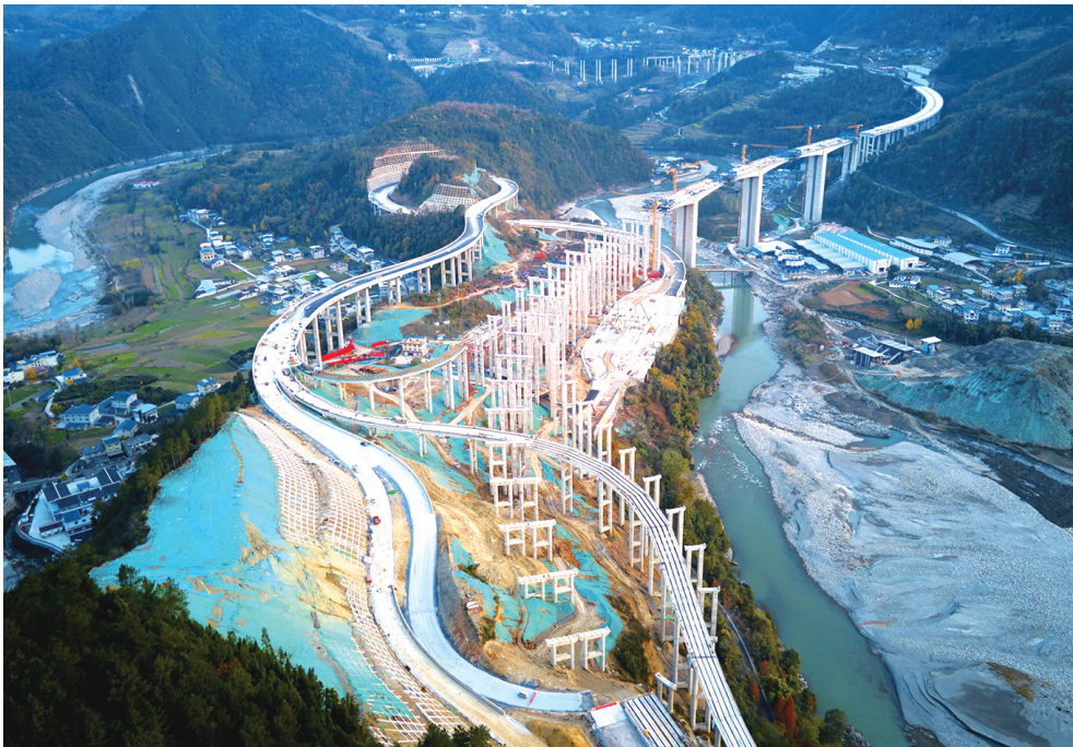
正在建设的九绵高速平武互通

今年以来,平武县从规划先行、组建专班、做实前期、资金和要素保障等方面,推进规划的交通项目落地开工、加快建设、如期投用。截至10月,平武县已完成交通投资38.9126亿元,其中九绵28.9798亿元,广平5.8518亿元,地方道路建设4.41亿元,各个重点交通项目正按路