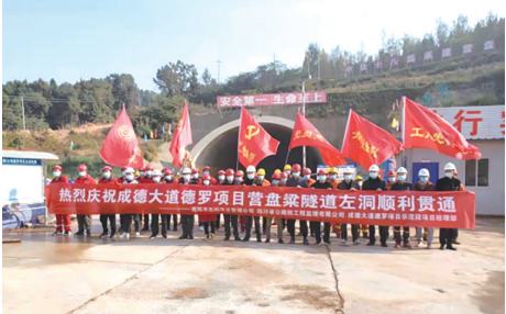
营盘梁隧道左洞顺利贯通

自党史学习教育开展以来,马边客运中心站始终坚持把“我为群众办实事”活动作为开展党史学习教育的着力点和落脚点,不断把党史学习教育成果转化为为彝汉等群众办实事、办实事、解难题的实际行动,不断满足人民日益增长的美好生活需要,增强人民的获得感、幸福感和安全感。