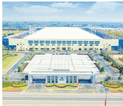
通威太阳能(眉山)有限公司鸟瞰图

企业培育提质增效。新培育8户国家级专精特新小巨人企业,累计达到12户,居全省第4位,18户企业进入省级专精特新公示名单;预计全年,50户重点企业占全市工业比重37%以上,其中通威太阳能将突破100亿元;新增规模以上工业企业98户以上,总户数达710户以