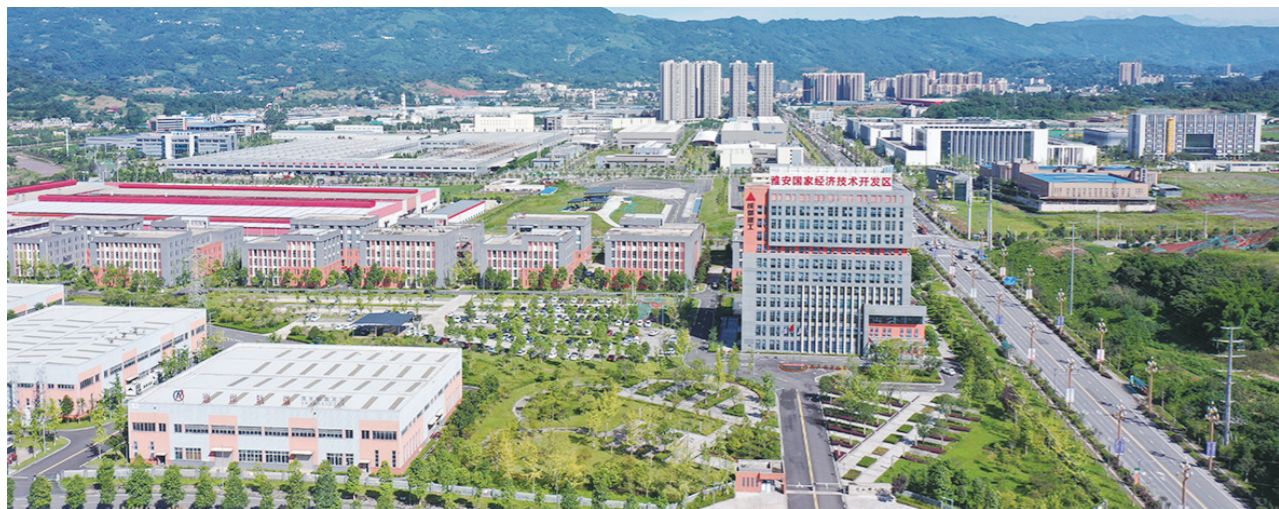
雅安经济技术开发区鸟瞰图