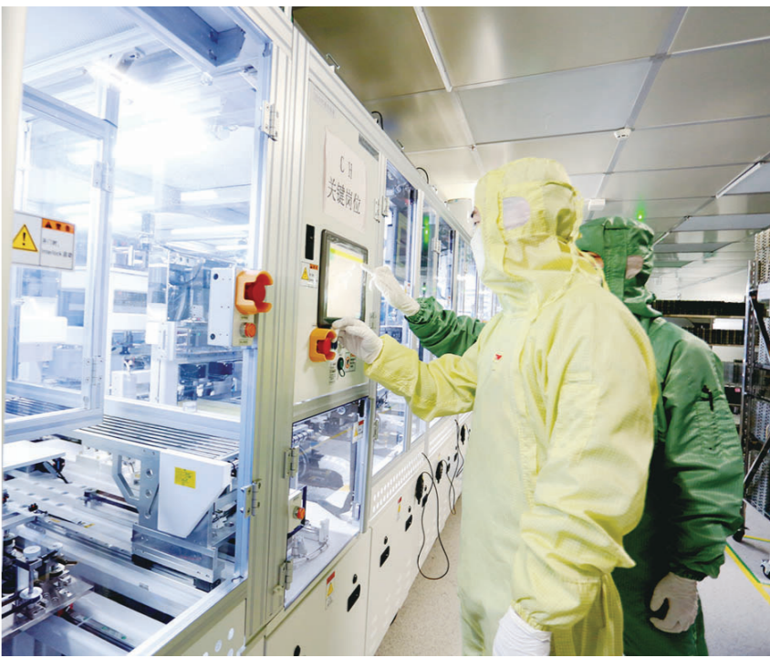
眉山(信利)仁寿高端显示科技有限公司模组车间