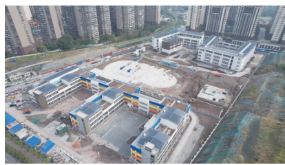
资中县凤凰教育园区

代化装备全面普及,标准化畜禽养殖圈舍全面建成,农业信息化物联网提档升级,产业园功能配套,各项要素齐聚,一个“产业特色鲜明、优质要素聚集、功能配套完善、产业发展领先、政策支持有力、体制机制创新”的科技引领型国家现代农业产业园已基本建成。 在现代农业稳步提升的同时,资中县坚持工业绿色低碳发展方向。 资中主动顺应“三新一高”要求,聚焦实现碳达峰、碳中和目标,以能源绿色低碳发展为核心,按照“双碳”引领、做强优势,科技创新、数字赋能,龙头带动、集聚发展,政府引导、市场主导”的原则,主动融入成渝地区产业链和供应链,科学处理发展和减排、整体和局部、短期和中长期的关系,一手抓减污降碳协同增效,一手抓绿色低碳产业发展,加快转变发展方式、调整能源结构,优化产业结构,转换增长动力,服务国家、省市发展大局,促进经济社会发展全面绿色转型。 近日召开的资中县委十五届四次全会指出,要加快页岩气综合利用,积极发展绿色建材产业,培育煤层气、氢能、生物燃料产业集群,推动绿色低碳优势产业发展。要推动传统产业节能降碳改造,实施清洁能源替代工程,