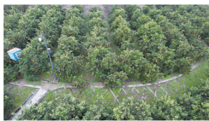
资中血橙种植基地