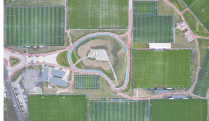
连界足球实训基地

强企业、知名企业、商协会客商参加“2021川渝国企内江·荣昌行活动”“2021中外知名企业四川行”等省、市重大投资促进活动,自主举办“成渝地区双城经济圈中的新威远”2021年招商引资项目集中签约仪式,成功签约威远县汉兴页岩气高效制氢技术开发应用等重大产业项目。