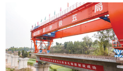
成自高铁威远段建设现场

园区内的康桥水乡、生态果林、环湖道路、民宿餐饮等项目已全部完成。目前,康桥水乡被正式列入国家AAA级旅游景区。 当前,高石镇兰田村红花湾田园综合体项目正在如火如荼建设中。项目规划总占地面积430亩。一期项目除道路及配套建设外,还将启动乡村文化综合体、乡村商业综合体、乡村车间和乡村湿地等建设。 …… 一幅幅乡村振兴的新画卷,正在这片充满希望的大地上徐徐铺开。 威远县坚持把实施乡村振兴战略作为新时代“三农”工作的总抓手,大力推进巩固脱贫攻坚成果同乡村振兴有效衔接,着力培育农村新产业新业态,促进农民增收致富,奋力谱写新时代威远乡村振兴新篇章。 威远县积极创建无花果、中药材、茶叶、樱桃、蚕桑、柠檬、花椒等现代农业园区,形成“东中药材+南无花果+西樱桃+北茶叶+全域粮油生猪”的产业发展格局,让产业发展成为强化乡村振兴功能的重要途径。