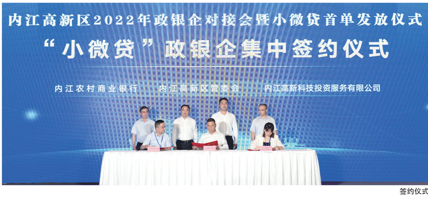
内江高新区2022年政银企对接会暨小微贷首单发放仪式 “小微贷”政银企集中签约仪式

据悉,为解决小微企业融资难、融资贵的问题,内江高新区联合内江农商银行推出“小微贷”产品。小微贷是向注册地和经营地在内江高新区行政区域内小微企业和个体工商户发放的,享受财政贴息和企业增信的贷款。凡是办理“小微贷”的小微企业、个体工商户均可享受财政贴息。比如,一家规模以上企业贷款100万元,按照年利率3.7%计算,每月利息约3084元,小微贷享受贴息后每月利息低至1542元,每月可节省1542元。同时,企业通过内江高新投控公司增信可以增加贷款额度。比如授信100万元的企业,如果获得内江高新投控公司增信,就可以增加10%的额度,授信110万元。