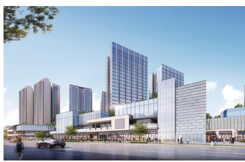
天府国际动漫城效果图

砥砺前行中,一个个项目如同一个个动人的“音符”,一个生机盎然宜居宜业的新“新北”正款款向我们走来。