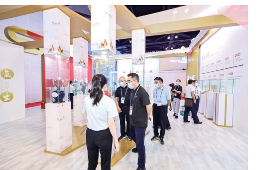
嘉宾、客商在五粮液展厅参观、品鉴

同时,五粮液加快全球市场布局。目前,五粮液已设立亚太、欧洲、美洲三大国际营销中心,在日本东京、中国香港等地设有五粮液大酒家,在德国杜塞尔多夫等地建有五粮液品鉴中心,大力拓展海外市场。 以酒为媒,向世界讲好中国白酒故事,稳步推进国际化拓展之路一直是五粮液作为中国白酒领军品牌的责任和担当。借助本届东博会平台,五粮液将发挥战略合作伙伴作用,用心用力讲好中国白酒故事,积极支持东博会举办的系列活动,携手东博会推动与东盟各国合作伙伴增进互信、深化合作,引领中国白酒加快走向世界舞台。