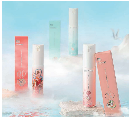
“仙子”系列驱蚊喷雾