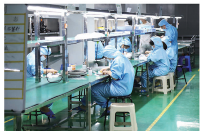
生产车间工人忙生产