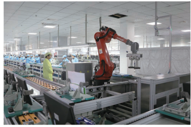
智能终端产业液晶显示屏生产车间