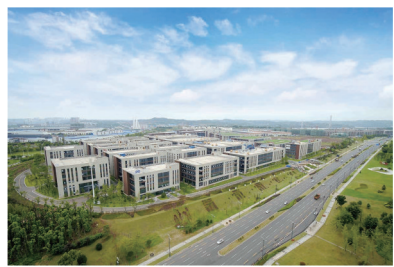
高新区智能终端产业园鸟瞰图

近年来,泸州高新区认真贯彻落实党中央、国务院及省委、省政府决策部署,紧紧围绕泸州“一体两翼”特色发展战略,努力将泸州高新区打造成为泸州经济高质量发展的重要增长极和新的动力源。2021年,泸州高新区实现营业收入1124.9亿元,同比增长14.8%,在全国国家级高新区综合排名第98位,较上一年度上升了14名,提前跨越式晋级全国百强高新区。