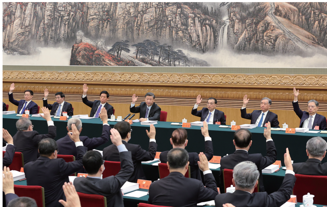
10月21日,中国共产党第二十次全国代表大会主席团在北京人民大会堂举行第三次会议。习近平、李克强、栗战书、汪洋、王沪宁、赵乐际、韩正等出席会议。