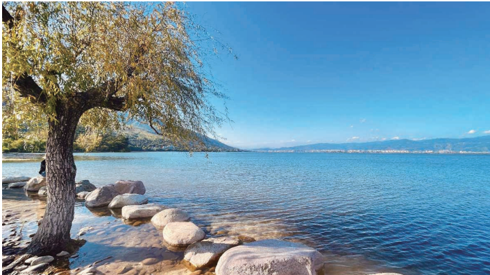
银鳞沙滩旁的海岸线

今年10月,历时9个月提升改造后的邛海西岸湿地公园以全新面貌再次惊艳亮相。公园在保留原有湿地生态美景、文化记忆的基础上,传承自然山水造园底色,在生态、文态、业态、形态“四态”上全面提升,