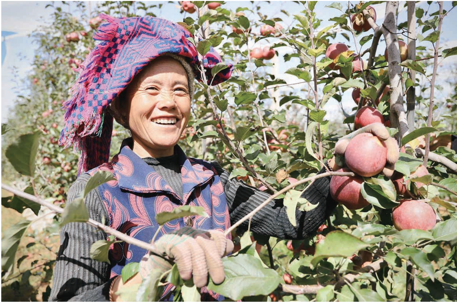
红苹果映红了采摘村民的笑脸

10月24日-30日,在凉山州建州70周年之际,作为州庆系列庆祝活动的重要载体之一,由凉山州委宣传部、四川经济日报社主办的以“感恩奋进铸就七十载辉煌·牢记嘱托书写新时代华章”为主题的全国经济媒体暨四川省报纸副刊凉山采风活动举行,嘉宾们以“实地调研+现场采访+互动交流”的形式,走进盐源县兴隆镇苹果现代园区、邛海国家湿地公园、西昌建川电影博物馆、大石板村等点位,丈量凉山土地,讲述凉山故事,传播凉山声音,深入探寻凉山历史之美、山川之美、文化之美。