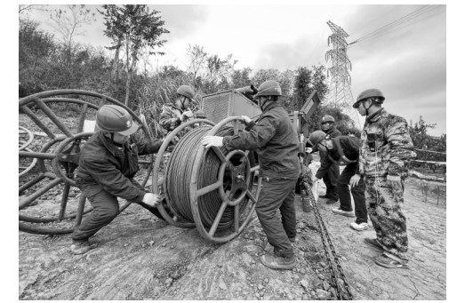
施工人员正在进行导线张力场准备工作

在白酒行业中,历来有“七分酒三分勾”之说,尝评、勾调向来是白酒生产环节中非常重要的一环,关乎着酒体的质量,因而需要勾兑师敏锐的味觉和嗅觉。同样,要历经后天的千锤百炼,只有经验丰富的勾兑师才能调出风味独特的白酒。