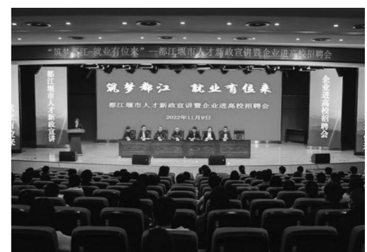
都江堰人才新政宣讲会