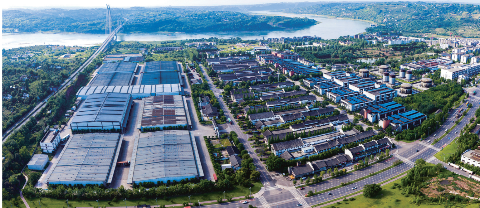
酒业园区工业板块鸟瞰

酒业园区以奋进新征程的担当和使命,不断探索前行,走出了一条独具特色的“人产城境”融合发展之路,各项事业不断开创新局面,全力以赴建设世界白酒文化旅游目的地和成渝地区消费转型升级新地标,聚力打造世界级优质白酒产业集群。