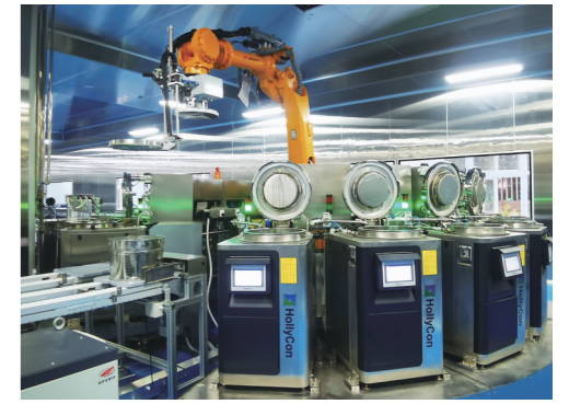
天植中药智能药房