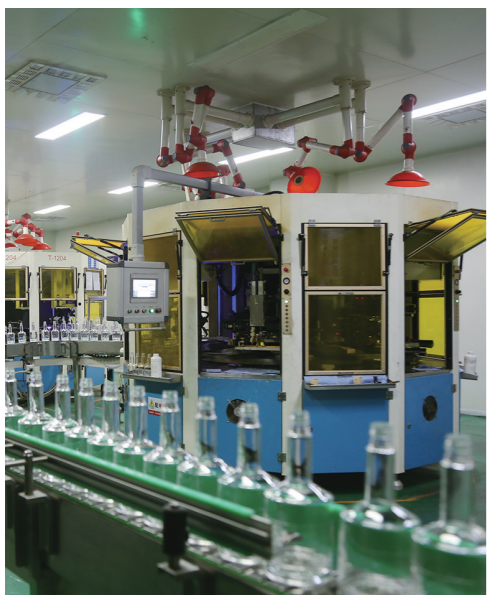
中科玻璃自动化生产车间