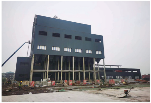
中信建设150万吨进口粮食深加工项目