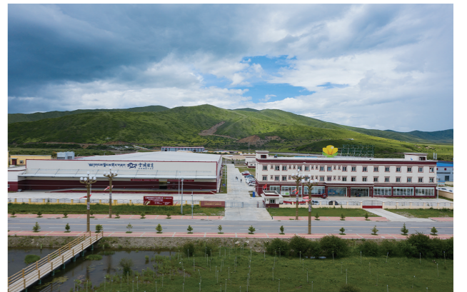
红原县绿色产业园区红原县红原新希望牦牛产业有限公司全景图