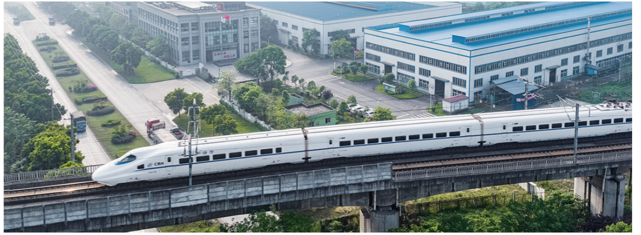
中车紧固件制造基地

园区强基提档攻坚。持续实施“亩均论英雄”综合评价,推进闲置低效工业用地清理处置,加快补齐和适度超前布局基础设施建设,推动园区绿色化、专业化、特色化发展。