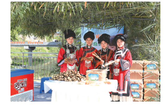
“琳三妹”现场直播带货(峨边竹笋)