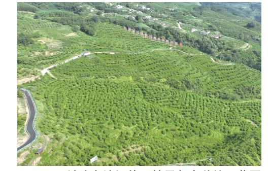
峨边白沙河片区粮果复合种植示范园

植基地项目的实施，公司将向该种植基地项目提供有机肥，帮助种植基地项目降本增效，真正做到种养循环可持续发展。近年来，峨边县以“大食物观”统筹发展生猪等重要农产品，主要以养殖生猪、肉牛、肉羊、小家禽为主，逐步形成大堡镇—五渡镇生猪发展产业带、勒乌乡—毛坪镇肉牛肉羊产业带。2023年，全县将建成生猪产期调控基地19个，培育规模养殖场44家。全年生猪存栏11.58万头，能繁母猪存栏1.16万头，生猪出栏16.88万头；水产养殖产量144吨；牛出栏0.806万头，羊出栏2.509万只，家禽出栏109.34万只，禽蛋产量0.313万吨。