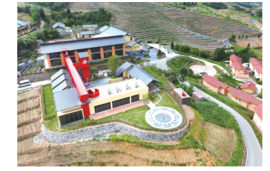
峨边茗新村“彝步千年·文旅新寨”