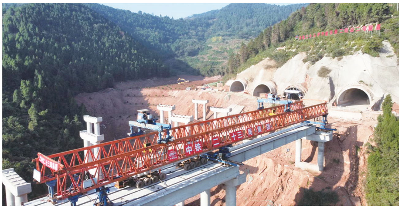
天府大道南延线——天府仁寿大道二峨山隧道

四川经济日报讯 11月7日,从中铁二十三局传来消息,天府大道南延线——天府仁寿大道建设取得突破性进展,全线仅剩在建的二峨山隧道全部贯通,为2024年天府仁寿大道全线建成通车奠定坚实基础。