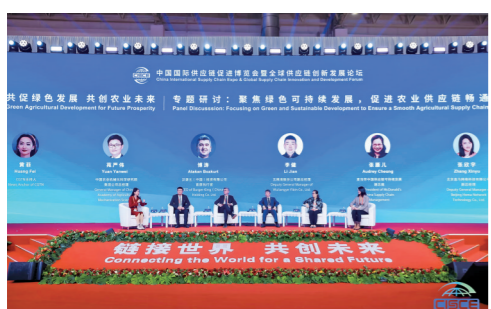
绿色农业专题论坛现场