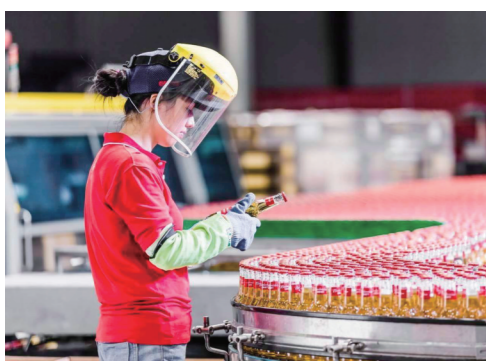
百威(四川)啤酒有限公司资阳工厂生产车间