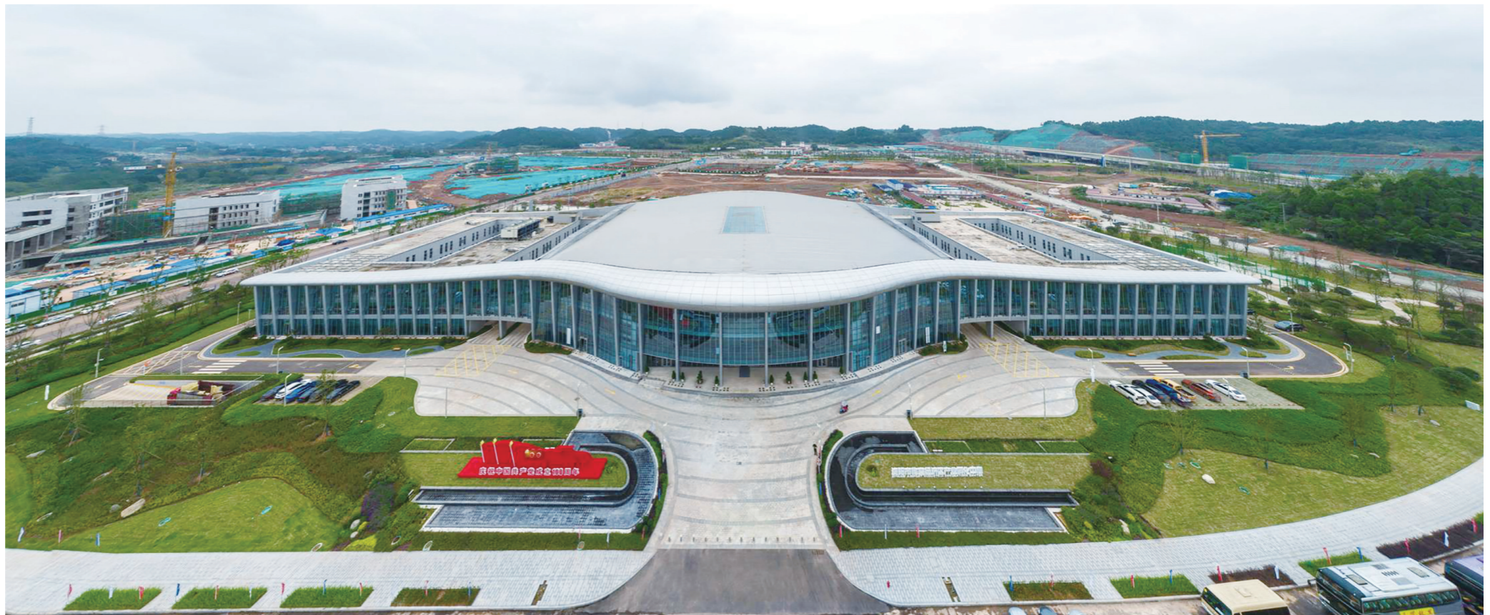
资阳临空经济区产业孵化中心