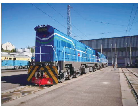
中车资阳机车有限公司HXN6型混合动力机车