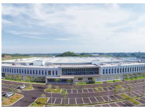
爱齐(四川)医疗设备有限公司