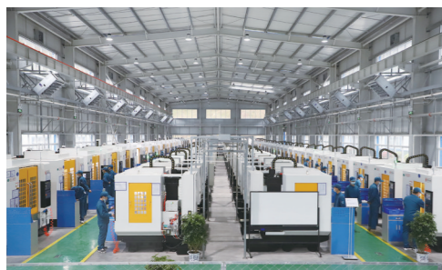
九天真空生产车间