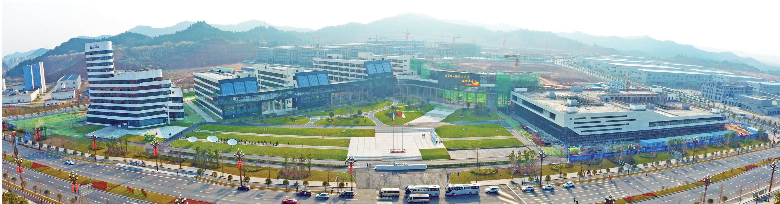
南充临江新区现代产业集群快速崛起。图为华讯方舟天谷·南充智能信息产业园

白纸作画,平地成城。2020年7月,四川省人民政府正式批复同意设立南充临江新区。承载国家战略、担负时代使命、引领区域发展,临江新区的盛世启航,让南充“建设成渝第二城”实现高点起步、“争创全省经济副中心”再度乘势而上、“打造成渝地区双城经济圈次极核”率先北翼引爆。