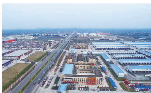
国家级示范物流园区——南充现代物流园