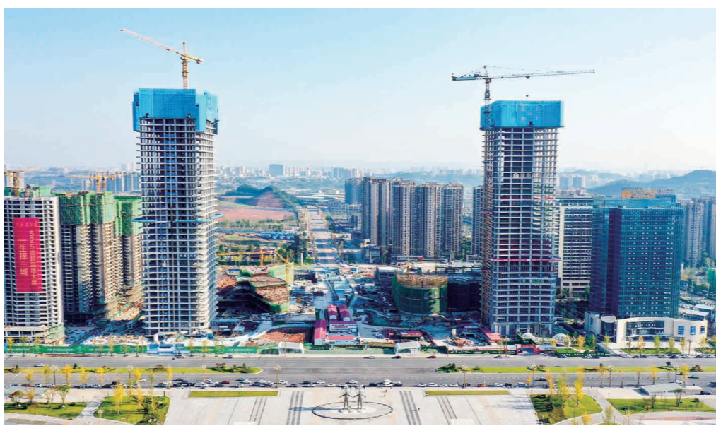
在南充临江新区高铁商务区,已经封顶的238米第一高楼南充双子塔巍峨耸立,直插云霄

据悉,2021年南充临江新区将实施重点项目167个,计划总投资2838亿元,年度计划投资539.4亿元。其中顺庆片区实施重点项目65个,总投资1338.8亿元,年度计划投资209.8亿元;高坪片区实施重点项目62个,总投资815.9亿元,年度计划投资203.6亿元;西充片区实施重点项目40