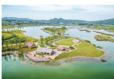
中法农业科技园