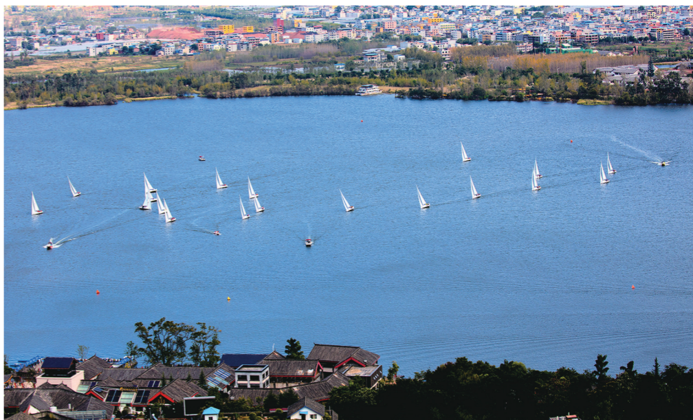
西昌邛海是安宁河谷湖盆平原的典型

本版所登稿件若需转载或编辑出版,应经本报许可同意,并按有关规定向作者支付稿费。否则将追究法律责任。