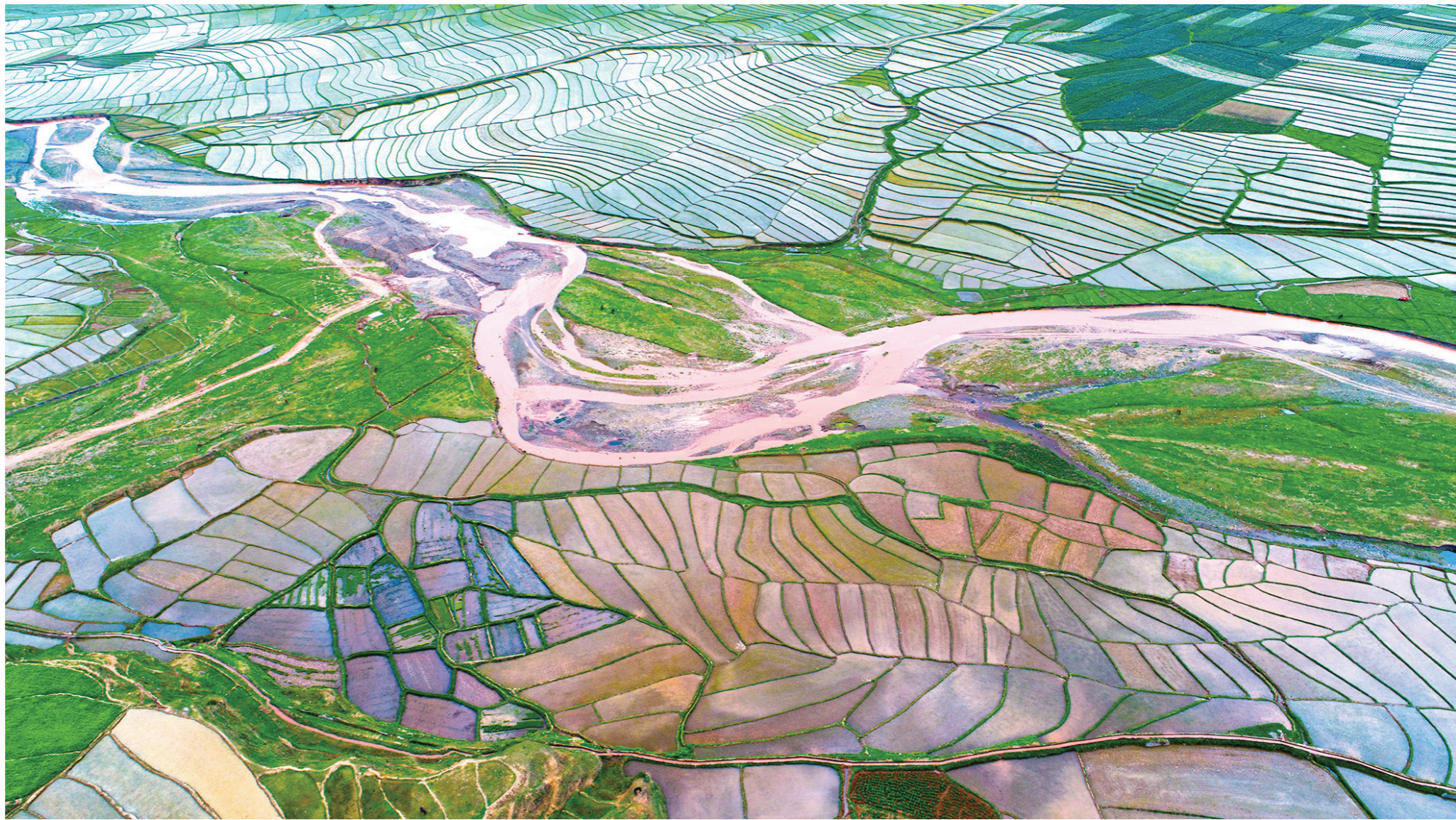
物产丰饶、宜居宜业的安宁河谷平原

安宁河谷孕育了特殊的自然地理:温度、空气湿度、海拔高度、农作物产量、空气洁净度和森林覆盖度等,“六度”皆宜。这里四季瓜果飘香,月月花朵盛开,高原季风气候形成了热带、亚热带及温带水果轮番上市的热带景象,而在河岸边、街道旁,火红的攀枝花、刺桐花,蓝紫的蓝花楹,还有随处可见的三角梅,无不令人心醉,因此安宁河谷有着“第二天府”的美誉。