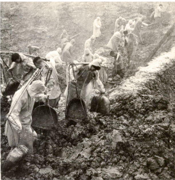
新五公社社员冒雨奋战在泖田改造工地

泖田人民自力更生,艰苦奋斗,彻底改变万亩泖田面貌的辉煌业绩,为后人留下坚实的物质基础和宝贵的精神财富。