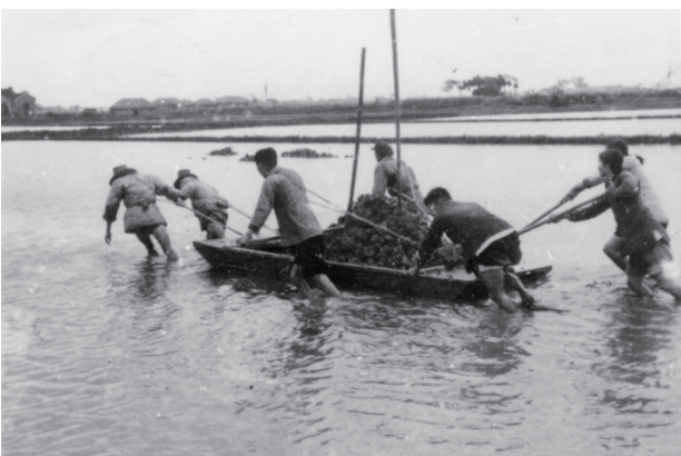
农民在低洼地中运土修圩