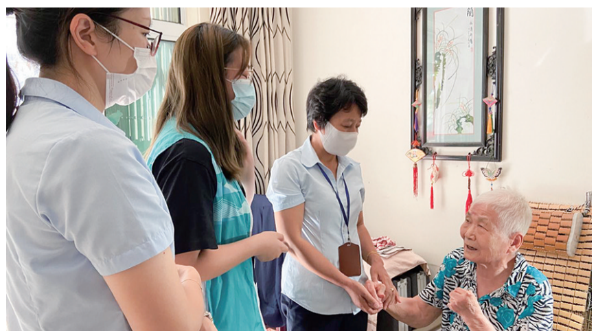
“暖心相伴服务队”走访结对老人,帮助解决“急难愁盼”问题。

松开物业公司常务副总经理方浩告诉记者,经过排摸,24个小区有高龄、残疾、独居等老人有百余户,为了更好地为老人们提供服务,公司建立了“一户一档,一事一记”的管理制度。