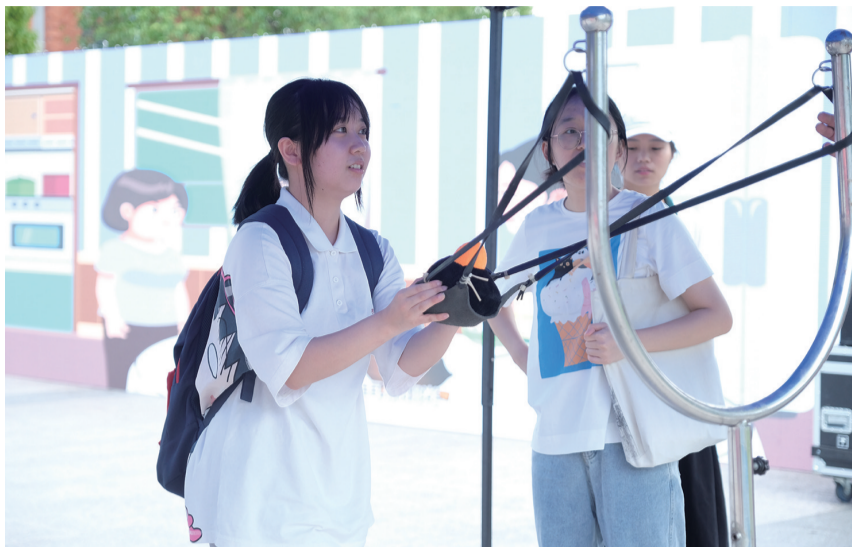
活动现场,趣味解压小游戏吸引学生踊跃参与。

活动现场,心理专家一对一解答了不少学生提出的焦虑抑郁、学业压力、人际关系等问题。现场播放的有关抑郁症、强迫症、惊恐障碍等精神健康科普视频吸引了不少师生驻足观看。“愤怒的小鸟”“疯狂斗牛机”和“打鼓达人”等趣味解压小游戏更是吸引了学生的踊跃参与。“近几年来,心理健康越来越受到关注,今天正好借助这个活动体验