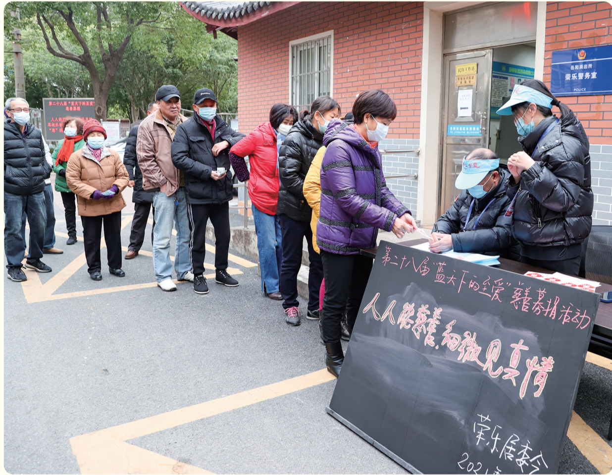
12月25日,荣乐小区居民在排队捐款,为寒冷的冬天带来融融暖意。

为了提升农户种植和及时采收秋冬茬蔬菜的积极性,唐纪华介绍,区农业部门正协调农保单位,探索开发稻茬蔬菜收入保险险种。同时,将筹划出台秋冬茬蔬菜考核补贴政策,根据蔬菜质量、商品性、产量等指标进行考核,给予种植户相应补贴。