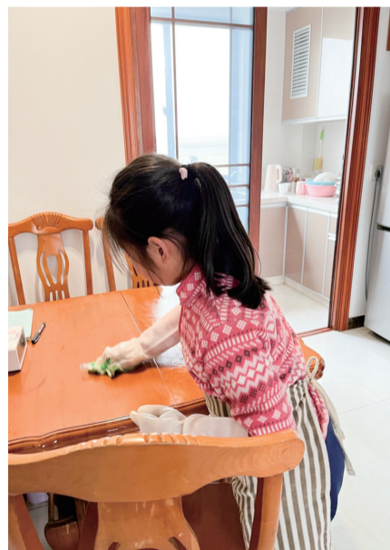
华政附校的学生们通过擦桌子等家务活学习摩擦力知识。