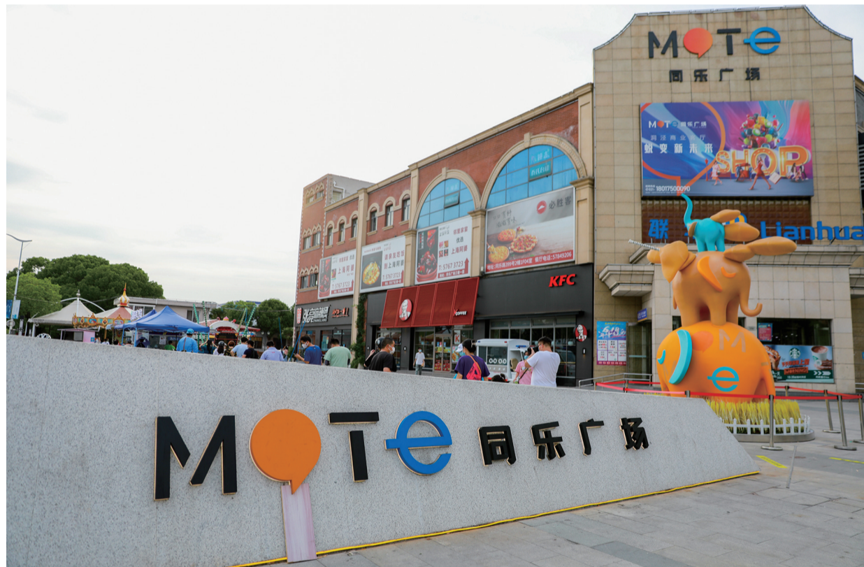
同乐生活广场位于同乐路蔡家浜路口,完成改造后,广场更注重商家品质。