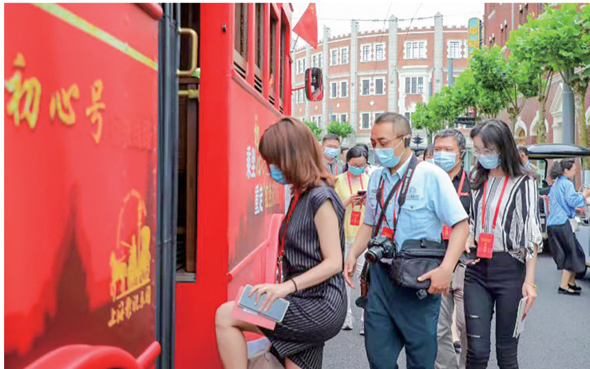
上海影视乐园推出以“乘坐初心号,重走红色光影路”为主题的党史教育创新课堂。图为游客踏上“红色巴士”。