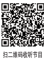
扫二维码收听节目

【链接】民生访谈节目《直播松江》的播出时间为每周一到周五上午10时至11时,欢迎拨打热线电话37683768,或下载“上海松江”App 点击首页,收看直播,给主持人留言、互动。也可通过首页点击云电台之《直播松江》进行回看。