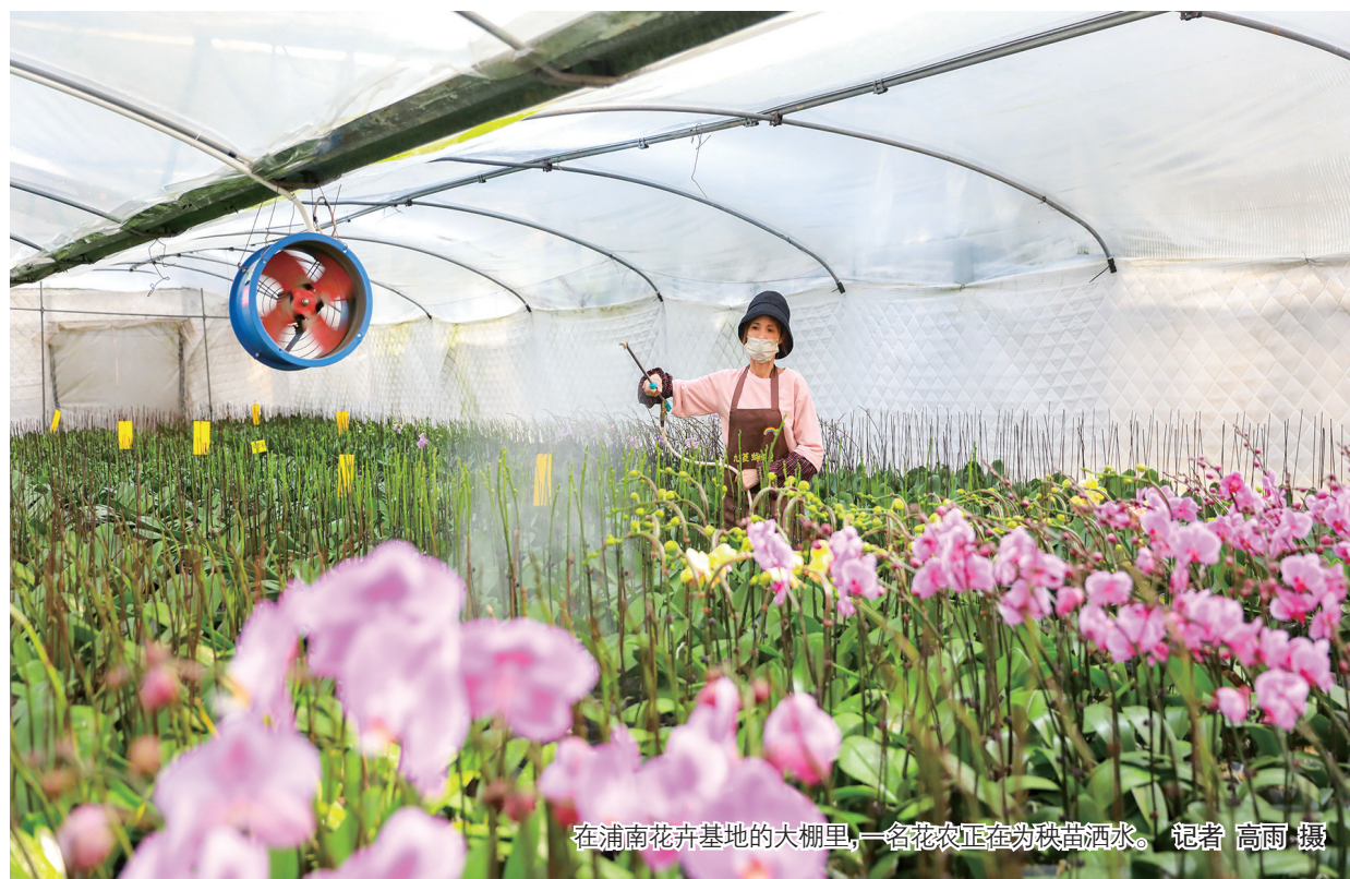
在浦南花卉基地的大棚里,一名花农正在为秧苗洒水。

据了解,2022年西部计划自4月18日启动招募以来,上海立信会计金融学院共有55名应届毕业生通过西部计划官网报名,经上海市西部计划项目办公室复试选拔综合评定及体检筛查,最终确定7名学生拟录取为西部计划志愿者。