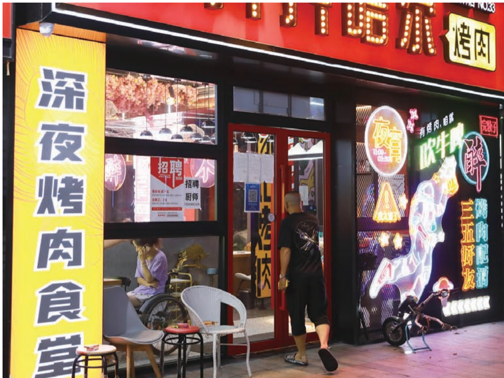
充满烟火气的烤肉店