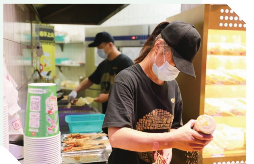
炸串店员工烹制烤串