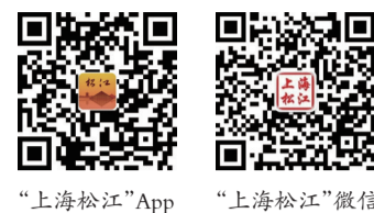
“上海松江”App “上海松江”微信