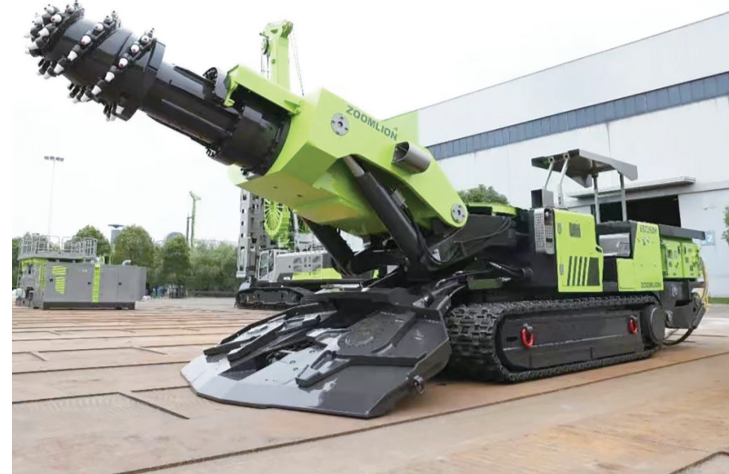
EBZ260H煤矿掘进机日前在上海中联重科桩工机械有限公司完成调试并下线。

据了解,启迪漕河泾智能制造孵化器是依托启迪漕河泾(中山)科技园打造的专业孵化器,面积约1.46万平方米。孵化器基地聚焦智能制造产业领域,配备检验检测公共实验室,搭建智能