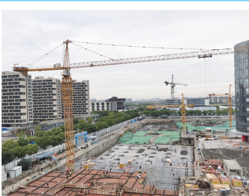
眼下,中山街道一个个在建产业项目正紧扣时间节点全力提速增效,奋力冲刺全年目标任务,为推动中山街道高质量发展集聚动能。图为近日海尔智谷三期项目建设如火如荼,施工现场工人们正在加紧施工,抢抓建设进度。

据了解,上海天美作为松江区唯一获得此次标准项目奖项,也是唯一一家参与修订此项国际标准的企业,离不开区市场监管局前期的精准指导。区市场监管局从辖区内近五年参与过国际标准、国家标准和行业标准等政府类标准制修订的企业名单中进行筛选,精准指导、推荐上报。“下一步,我们将以《松江区助推高质量发展专项资金管理办法》的实施为契机,鼓励更多行业标杆企业参与国际标准、国家标准、行业标准的制修订,推动松江经济社会高质量发展,打造更多‘上海标准’。”区市场监管局相关负责人表示。