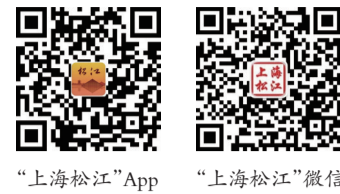
“上海松江”App “上海松江”微信