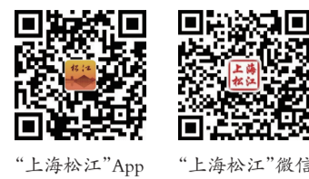
“上海松江”App “上海松江”微信