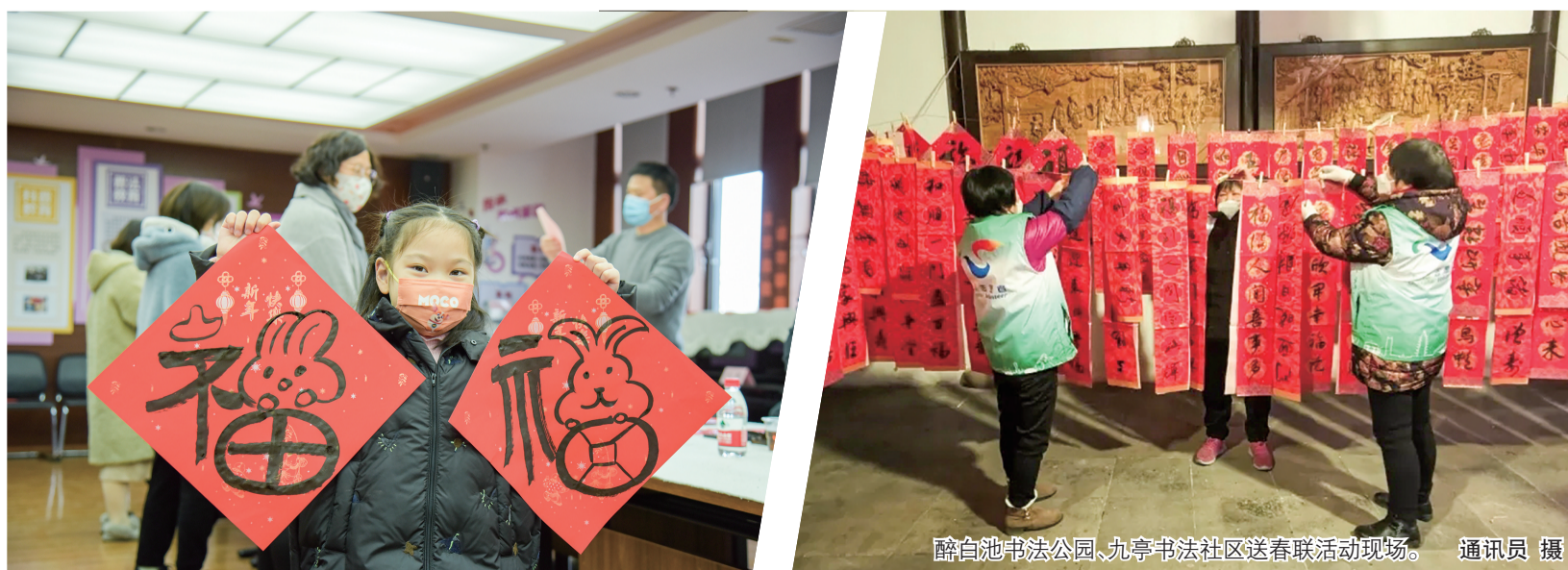
醉白池书法公园、九亭书法社区送春联活动现场。