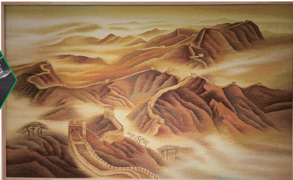
林乐成作品《金色长城》