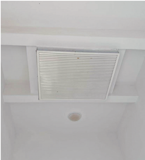
楼顶安装了正压送风系统。