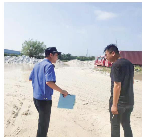
泖港城管中队执法人员在工地检查扬尘情况。