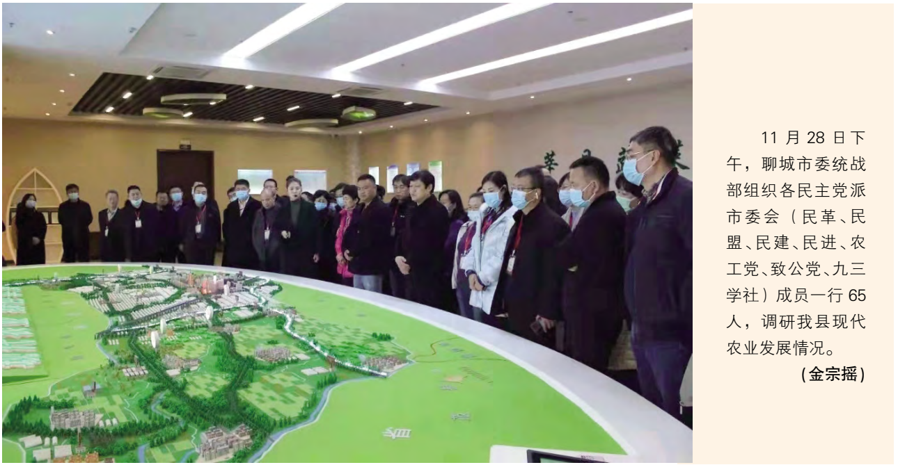
11 月 28 日下午，聊城市委统战部组织各民主党派市委会（民革、民盟、民建、民进、农工党、致公党、九三学社）成员一行 65 人，调研我县现代农业发展情况。