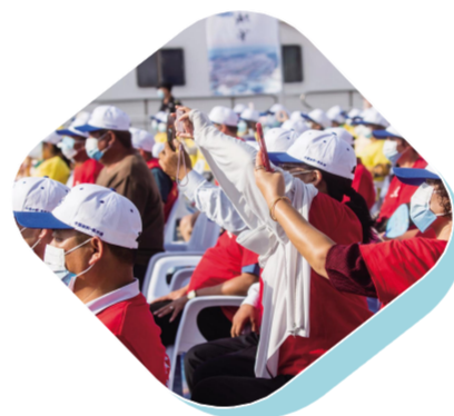
现场观众目不转睛的望着舞台,生怕错过精彩瞬间。