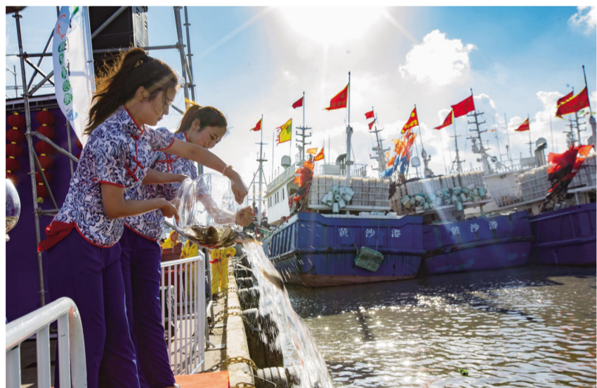
渔民们现场放生鱼获,向大海许下心愿。