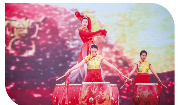
开场鼓舞以石破天惊的震撼声效和惊人视觉,拉开“第二届黄海国际开渔节”活动的帷幕。