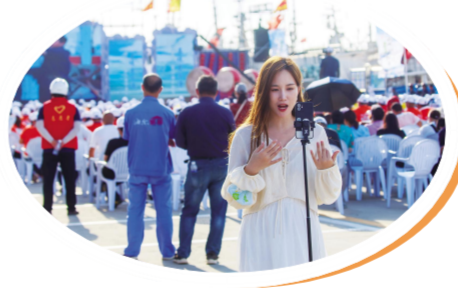
网红达人现场直播,为全网粉丝带去最美味、最新鲜的黄沙港海鲜。