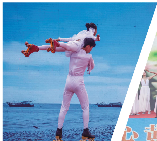
杂技节目《渔乡情》展现新时代渔民青春的活力和渔业丰收的喜悦。