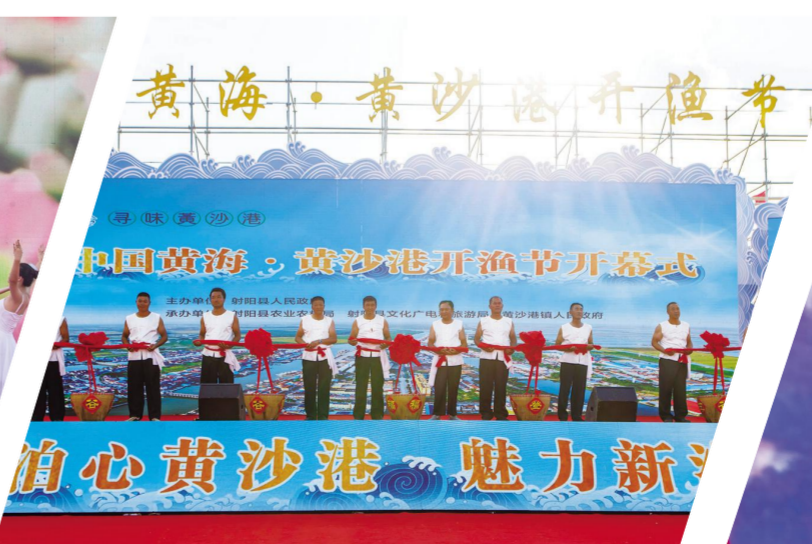
渔民抬着满满当当几大筐由花生、核桃等组成的五色果实祝愿一帆风顺。