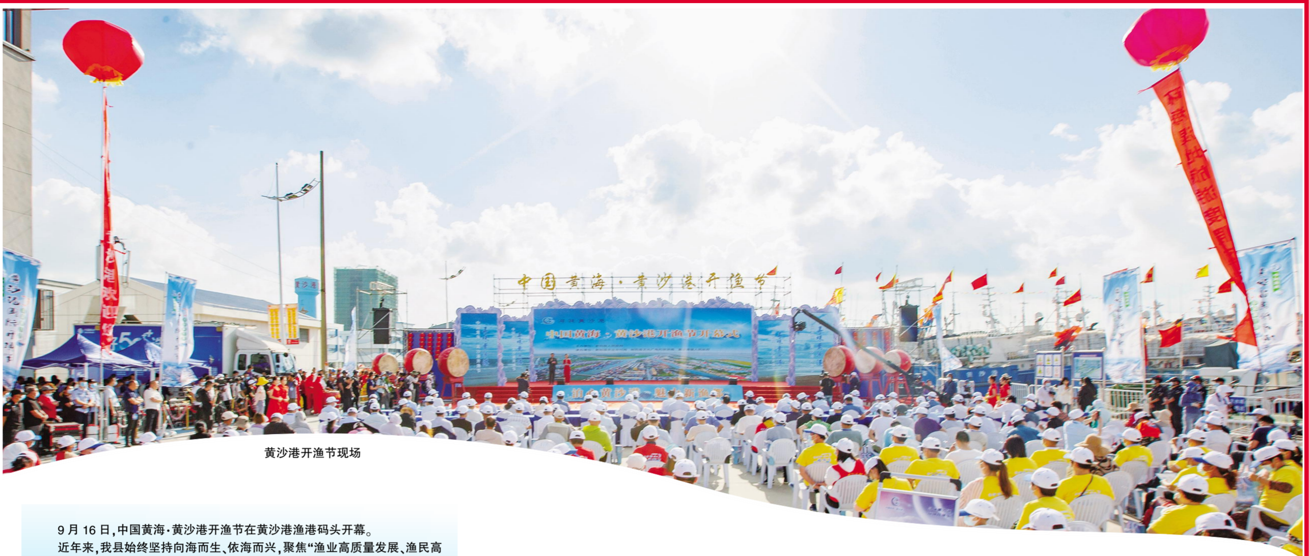
黄沙港开渔节现场

9月16日,中国黄海·黄沙港开渔节在黄沙港渔港码头开幕。 近年来,我县始终坚持向海而生、依海而兴,聚焦“渔业高质量发展、渔民高品质生活”目标,充分发挥黄沙港国家中心渔港引擎作用,精心打造“泊心·黄沙港”渔港小镇,形成集渔业生产、靠泊装卸、贸易集散、生活休闲、文化旅游等一体式服务体系,实现了渔港、渔产、渔镇融合发展、互动并进。 举办开渔节,既是对海洋文化、渔耕文明的延续和传承,更吹响了射阳向海图强、扬波大海的号角。中国黄海·黄沙港开渔节以“寻味黄沙港”为主题,在9月16日至10月7日,举办百味渔城海鲜美食节、海鲜烹饪大赛、“鱼眼看世界”开馆暨射阳县研学旅行实践教育基地授牌仪式、“我EYE黄沙港·泊心等你来”青年短视频直播大赛、渔姑渔嫂织网比赛、渔获拍卖会、渔民画展等一系列丰富多彩的活动,突出打造“泊心·黄沙港”的城市名片,吸引广大游客前来休闲度假、旅游观光、修身养性,感受这座黄海文明渔都的无穷魅力。 现撷取部分优秀摄影作品予以刊登,以饕读者。