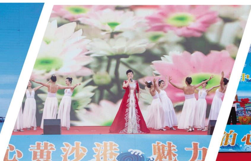
歌舞表演《在海一方》充满对黄沙港的无限祝福。