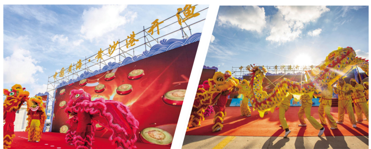
龙狮共舞《龙腾四海》