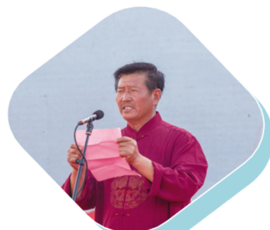
渔老大代表宣读海上安全生产承诺书。