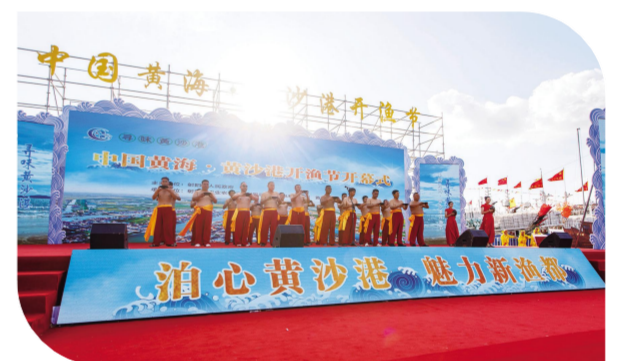
船老大们碗中斟满美酒,向海敬酒,祝愿渔业丰收。