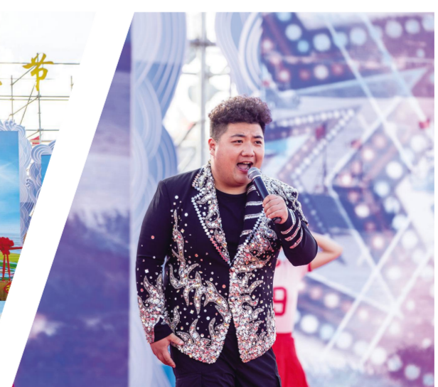
歌伴舞《新时代的捕鱼人》激情四溢。