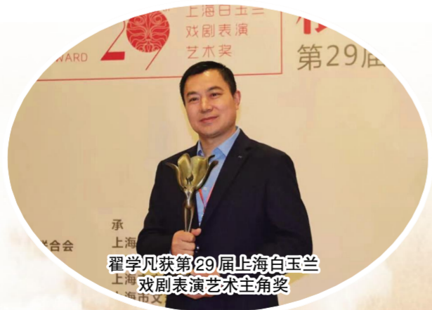
翟学凡获第29届上海白玉兰戏剧表演艺术主角奖