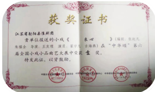
多部剧目获得省市各类大奖