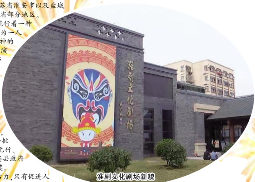
淮剧文化剧场新貌

如今，“海右戏苑”和射阳淮剧文化剧场建成后，“周末戏相逢”“戏约周三”等一场场精彩的戏曲演出也是场场爆满，让射阳市民过足戏瘾，极大地增强了射阳人民的幸福感，也让射阳的戏曲事业迎来了新的发展机遇。