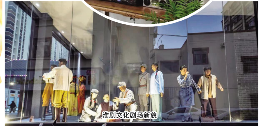
淮剧文化剧场新貌