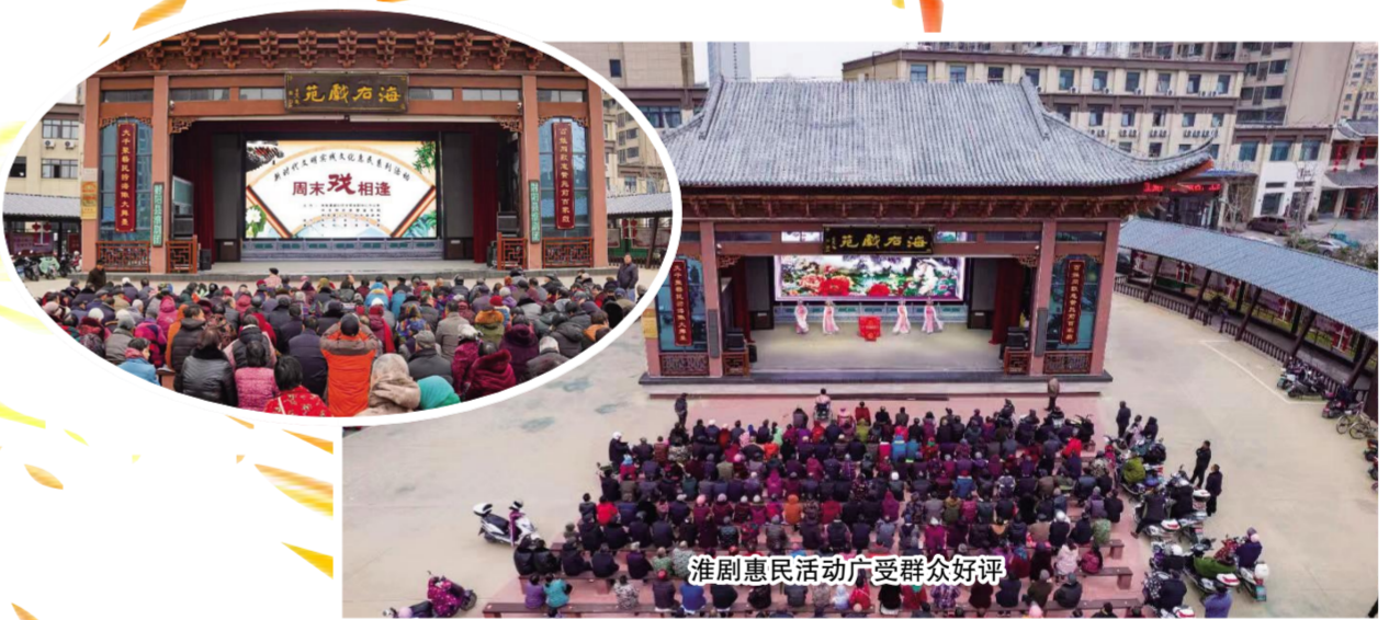
淮剧惠民活动广受群众好评