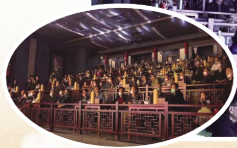
精彩的戏曲演出场场爆满，群众充分感受淮剧魅力