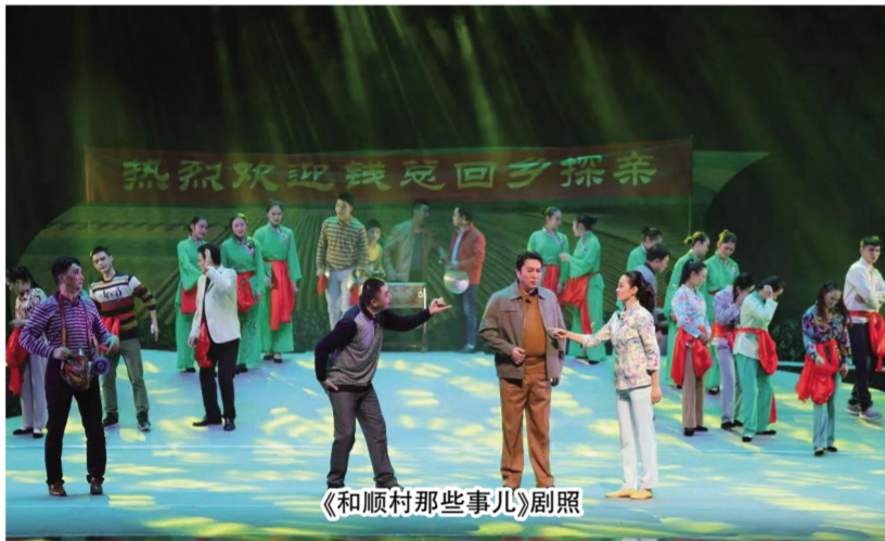
《和顺村那些事儿》剧照