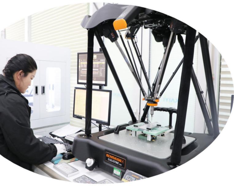
位于射阳经济开发区的盐城科群通讯科技有限公司总投资达9亿元,主要从事精密配件制造。项目全部投产后,可年产5000万件3C消费电子产品、20万套医疗器械结构件、10万件汽车电子金属零部件。