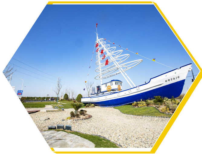
黄沙港渔船情景雕塑