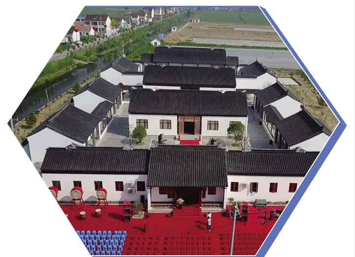
海河农耕文化博物馆