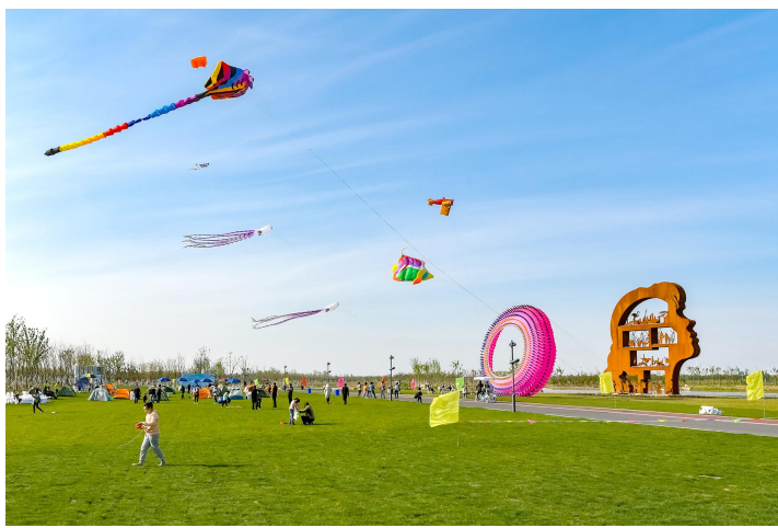
日月岛康养旅游度假区

鹤乡大地美景如画。近年来,县委、县政府秉持“人民至上”理念,精心打造一批民生工程,为群众提供更多更好的娱乐休闲去处。安徒生童话乐园内,精致的场馆、精妙的设计、精美的制作让人流连忘返,卖火柴的小女孩、拇指姑娘、皇帝的新装、丑小鸭四个主题童话故事在每个游人心中绽放。置身日月岛康养旅游度假区,绿荫环抱,风景宜人,远离城市的喧嚣,感受着来自大自然的清新与静谧。国家中心渔港黄沙港码头,一艘艘渔船满载而归,渔民们脸上洋溢着丰收的喜悦,渔港小镇建设如火如荼,渔文化景区初显美丽模样……黄海之滨,鹤乡这些景点等您来打卡。现撷取数幅摄影佳作,以飨读者。