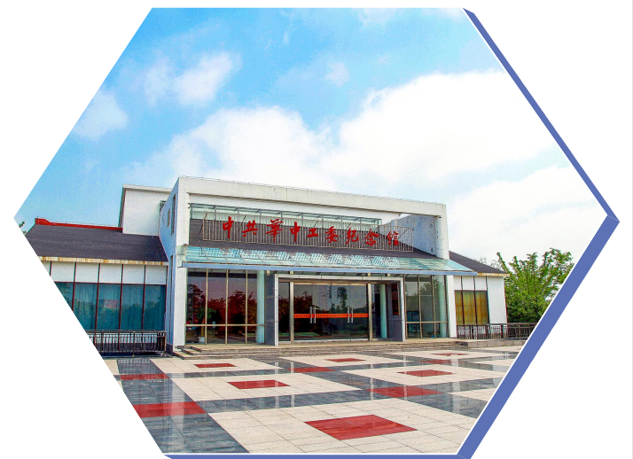
中共华中工委纪念馆