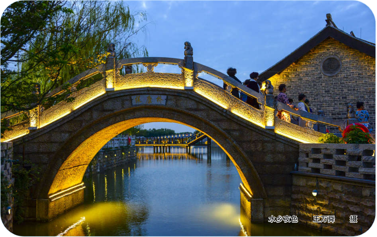
水乡夜色

腹有诗书气自华,懂得生活的人,会让自己的生命淌满书香。 有人说,要么读书,要么旅行,身体和心灵必须有一个在路上。及至而立,旅行数在我的生命里十指可数,一则没有时间,再有我其实是个很懒很懒的人,居一地十年,市区也只逛过一两次,加之想到节假日旅游景区人挤人的盛况,索性待家里或者到班上读书写字。所谓读万卷书,如行万里路,那些你想去的地方,又或者可望而不可即的地方,都能在书中实现。我打小就爱读书,倒不是期望从书中获得“颜如玉”和“黄金屋”,只是单纯喜欢书上的内容,喜欢读书时放空心灵的那种纯粹的安宁。在我看来,读书是场最好的修行,你读过的每一本书都藏着你的气质和修养。我愿做含着书卷墨香的女子,譬如《雨巷》中丁香般的姑娘,譬如人间四月天的林徽因。 读书的方式、场所也各不一样,或安静,或喧嚣,或许多人朗声齐读,或独自一人静心阅读,哪怕一人也可以有浅尝辄止地读和仔细咀嚼地读之分。但我以为,尽管书的内容可以分享,但读书的过程是自己的,唯有在安静的环境里读书才称得上真正的读书,就如同我们的人生一需要独自经历,享受独处,享受孤独。上学的时候,我最爱校园里的图书馆,此外,无论去哪里城市,我最爱的地方也是那些隐藏在喧嚣街角的书屋。因为爱读书,买新书时,我特意选了有书房的房型,在里面打了一整面墙的书柜,还精心布置每个卧室的飘窗。闲暇时,我最爱一个人坐在飘窗上,一本书,一茗茶,静静地享受浮生半日闲。我还习惯在床头摆放几本书,每天临睡前信手翻上几页。 床头放着的日本90岁仍未退休的心理医生中村恒子的生活哲理书《人间值得》,是前些日子在一位爱读书的领导推荐下所入,一直没时间阅读。还没翻开书便被封面吸引,恒子说“人生不必大用力,坦率地接受每一天”。直觉这是本适宜我的书,很薄,两晚便读完了,然而却饱含人生哲理,中村恒子用她一生的经历和智慧向我们阐述了工作、生活、人际关系等课题,尤其在“晚上归于平静”章节提到“对未来担心也没用,我只关心眼前的事”“闭上好好睡觉,确有急事时快速处理,其他一概不管”。这本书简直成了治好我近日报焦虑的良方。 读书的妙处许多,启迪智慧、陶冶情操、愉悦性灵、丰盛人生,如此等等,总之读书是很重要的。所以,当你觉得知识或能力不足的时候,当你觉得孤独抑或烦躁的时候,当你觉得累的时候,不如读书吧!