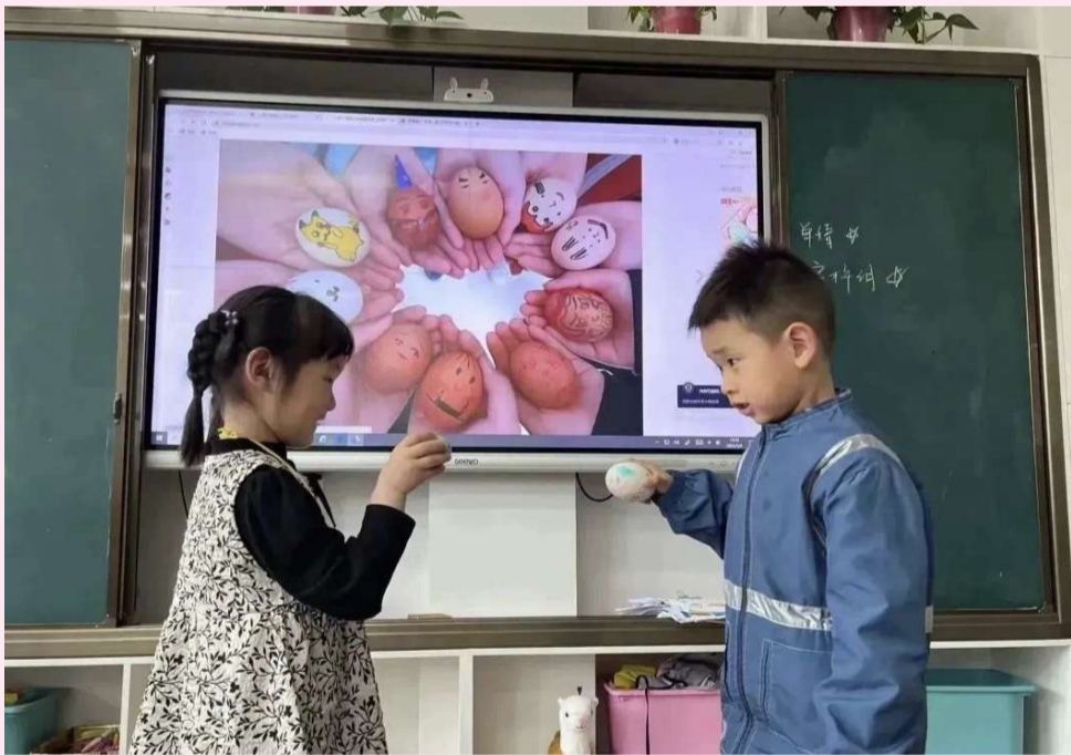
洞庭湖路幼儿园孩子们拿出蛋宝宝跃跃欲试,开始一场蛋王争霸赛