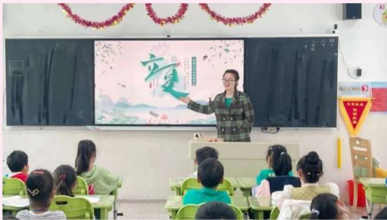
实验小学运河河校区老师们带领学生了解立夏节气,学习立夏的传统习俗和相关古诗词

“春意藏,夏初长,风暖人间草木香”,5月6日为2023年夏天的第一个节气——立夏。为传承优秀传统文化,体验立夏的习俗,我区各学校开展了丰富多彩的立夏主题活动,孩子们感受立夏、感受习俗,一起告别春天,迎接初夏的到来。