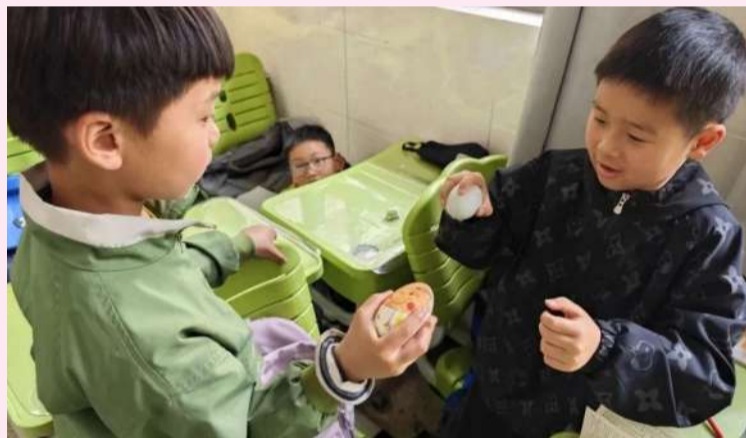
平潮小学的孩子们精心挑选“精兵强将”,准备“一战胜负”