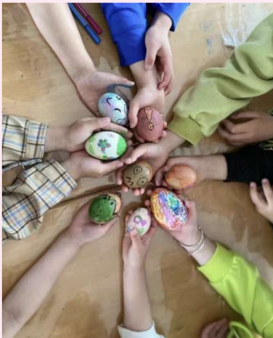
志新幼儿园的孩子们给一颗颗普通的鸡蛋穿上七彩衣裳