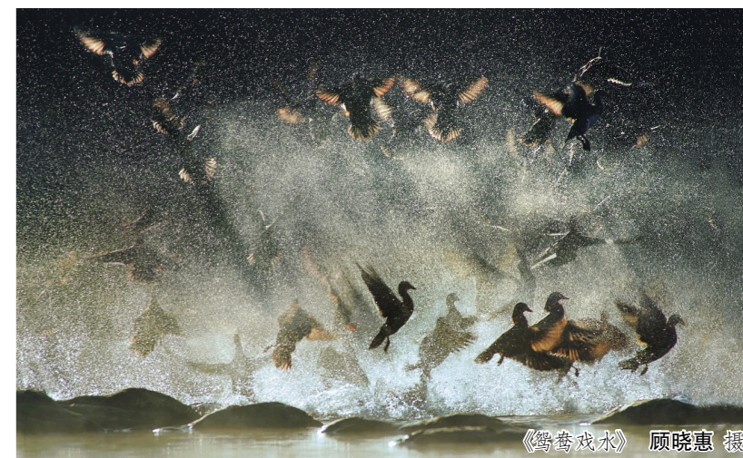
《鸕鹚戏水》