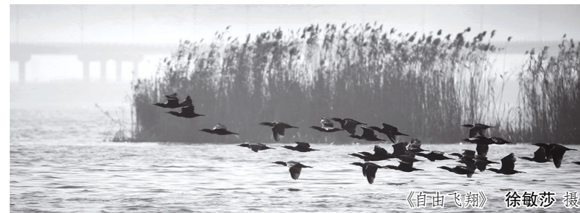
《自由飞翔》 徐敏莎 摄