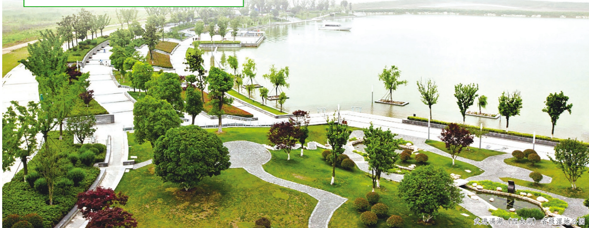
武进西太湖(西太湖)省级湿地公园

今年4月22日是第54个世界地球日，宣传主题为“珍爱地球 人与自然和谐共生”。为深入学习宣传贯彻党的二十大精神，引导全社会树立“尊重自然、顺应自然、保护自然”的生态文明理念，常州市自然资源和规划局武进分局结合世界野生动植物日、植树节、爱鸟周和世界地球日，开展了一系列内容丰富的宣传活动，动员全社会积极践行绿色低碳的生活方式，共同参与到自然资源保护的行列中，共建人与自然和谐共生的美丽武进。