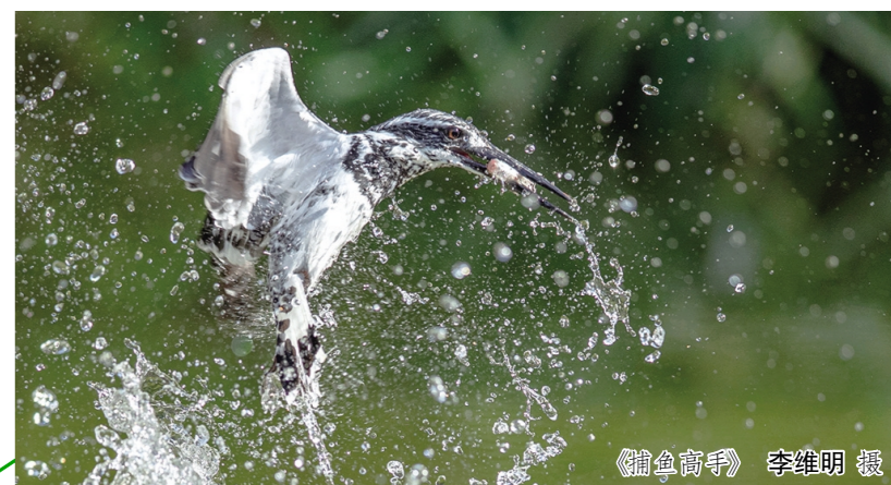
《捕鱼高手》