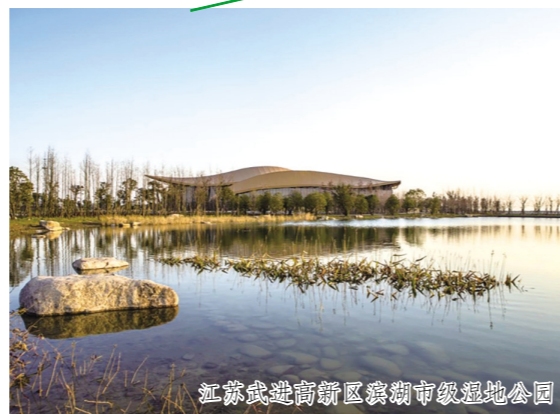
江苏武进高新区溇湖市级湿地公园

南河湿地保护小区；2022年设立430.81公顷溇湖(东岸片区)湿地保护小区。2021年，我区还开展了对自然保护区勘界立标工作。全区现有1个省级湿地公园、1个市级湿地公园、5个湿地保护小区，以及溇湖备用水源地保护区、溇湖国家级水产种质资源保护区、溇湖鲈鱼国家级水产种质资源保护区等多个湿地保护区。 下一步，我区将围绕常州市“532”发展战略，着力推进“最美湖湾城”建设，努力打造湿地净化、环境美化的新格局。今年，将修复生态湿地500亩，新建湿地保护小区1个。同时，加强湿地保护宣传，提高公众湿地保护认知度和社会参与度，营造湿地保护良好社会氛围，以生态发展之“能”托举绿色发展之“势”。