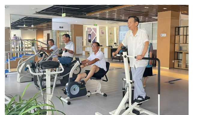
安康通智慧健康产业园总投资20亿元，以医养产业为主线，重点建设产业、康养、医疗三大片区，将聚焦大数据、云计算、移动互联网、人工智能等智慧养老新科技，重点引进数字健康、互联网医疗以及高端康养服务等产业，为老年人及儿童提供更高效、更便捷的高质量服务，建成后年产值达30亿元，税收超亿元。