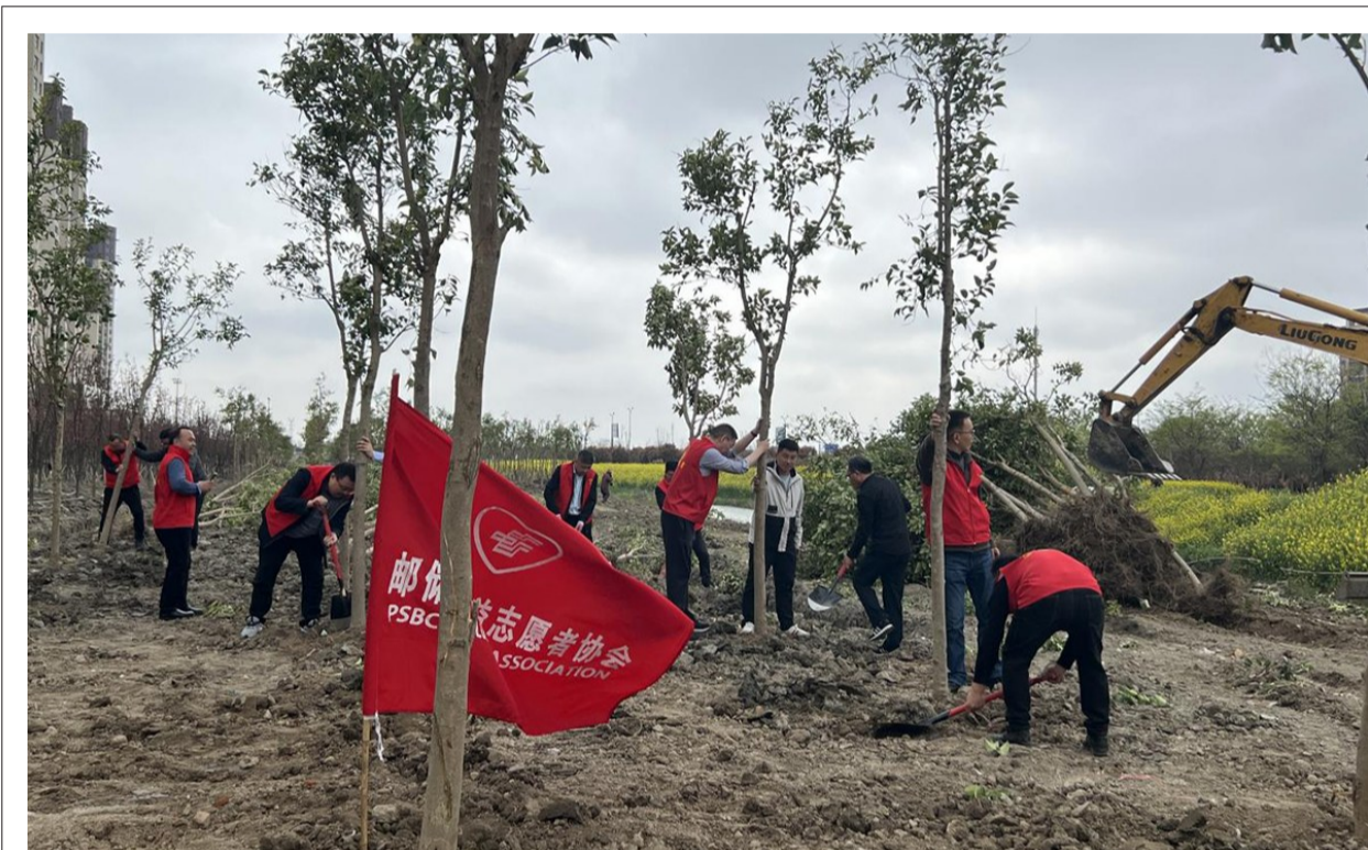
春风拂枝吐新绿,正是植树好时节。4月12日,伍佑街道珠溪社区联合邮储银行公益志愿者协会组织开展植树志愿服务,进一步凝聚了基层“党建+志愿服务”的强大合力,提升了大家的爱绿护绿和保护生态环境的意识。

从古至今,风华绝代,牡丹以巨丽之姿,独占花魁,受达官贵人推赏,文人雅士雅观,形成一种审美风尚。春风吹拂,万物生长,欢迎四海宾朋前来一睹百年牡丹芳华,共享珠溪古镇春日好时光。