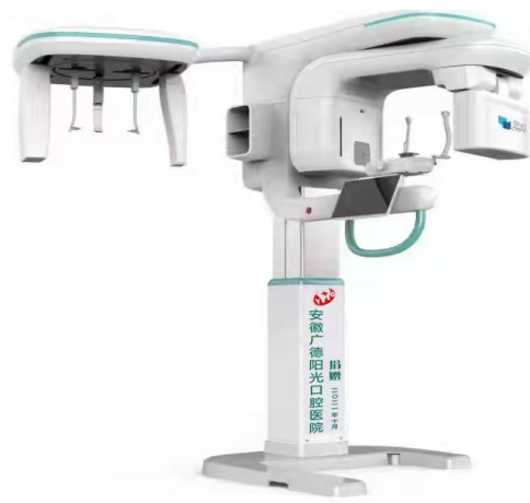
广德阳光口腔医院捐赠的CBCT机

近日,一张来自西藏自治区山南市人民医院的捐赠证书“飞”进了安徽省广德市阳光口腔医院,这张捐赠证书满载着4000多公里以外35.4万藏区人民的感激之情。