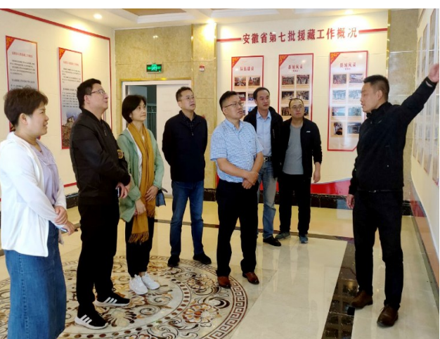
安徽省第七批援藏工作队介绍工作情况

据悉,广德阳光口腔医院援助活动分三个阶段进行:一是在2021年10月初已向山南市人民医院捐赠价值59.8万元的口腔CBCT机(口腔颌面锥形束计算机断层摄影设备)一台;二是拟在2022年8月底完成向山南市人民医院捐赠价值约30万元的医疗物资(已在筹备中);三是计划在2024年12月前,利用三年时