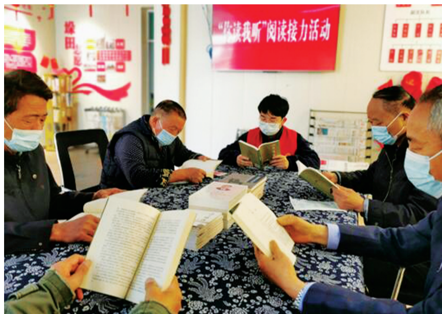
本报讯(通讯员 吴萍)日前,垛田街道开展的垛上读书会阅读推广活动中,垛上“读书人”带着阅读出发,感受一