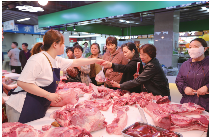
市民在商场一样的环境里买菜。

本报讯(特约通讯员 梅立成) 5月18日上午，兴化首家智慧菜场——城南邻里商业中心城南智慧菜场隆重开业。菜市场、民生事，是“烟火气、人情味”的聚集地，城南智慧菜场的出现，给市民们带来了焕然一新的感受！它和传统的菜场有什么不同呢？一起去看看吧！