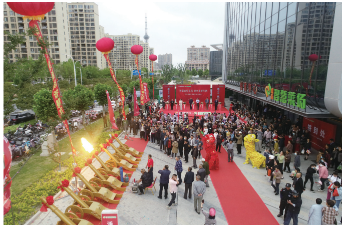
智慧菜场开业现场。