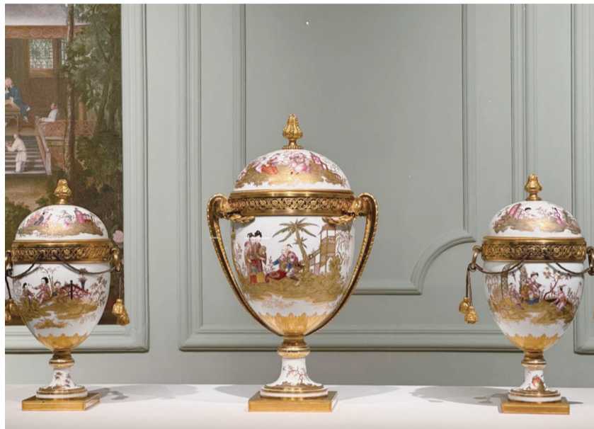
路易十六王后收藏的白色蛋形“中国风”瓷瓶。