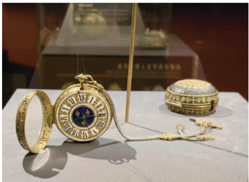
路易十四赠送康熙的怀表。

东风送暖，春回京城。故宫文华殿内，一件件瓷器、一幅幅画作被小心翼翼地层层包裹中取出，“唤醒”两三百年来中国与法国文化交往的历史记忆。